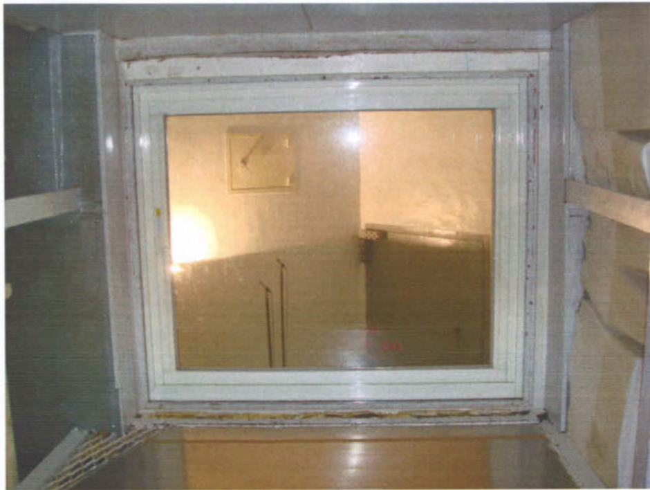
圖 1 試樣佈置圖 (無響室)